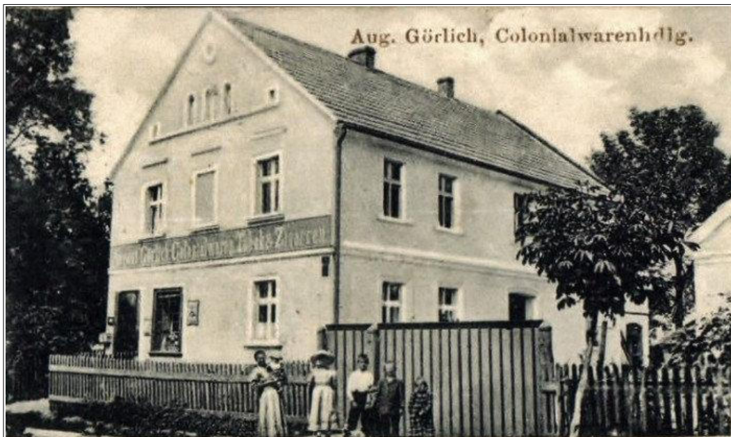
Aug. Görlich, Colonialwarenhdlg.