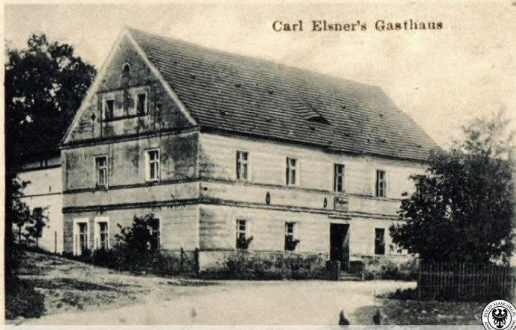
Carl Elsner's Gasthaus